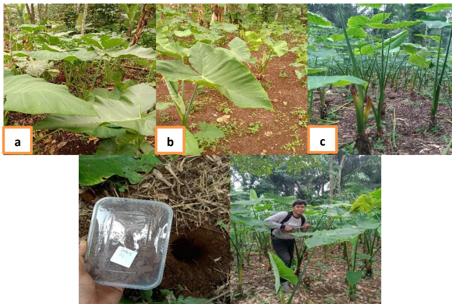
Gambar 3. Lahan Talas Beneng; a. Kaduengang; b. Juhut; c. Talaga Warna

Hasil analisis erodibilitas menunjukkan variasi yang berkisar dari kategori agak tinggi hingga tinggi. Salah satu faktor utama yang mempengaruhi nilai erodibilitas adalah tekstur tanah. Desa Kaduengang memiliki tekstur tanah yang lebih dominan pasir, sehingga ikut andil yang lebih banyak dari kenaikan nilai erodibilitas.. Tanah yang memiliki kandungan pasir yang signifikan cenderung lebih